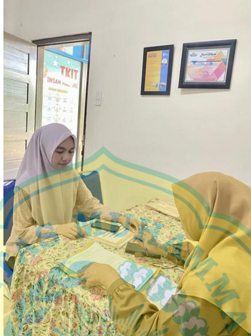
Pelaku Usaha Tempat Penitipan Anak Im