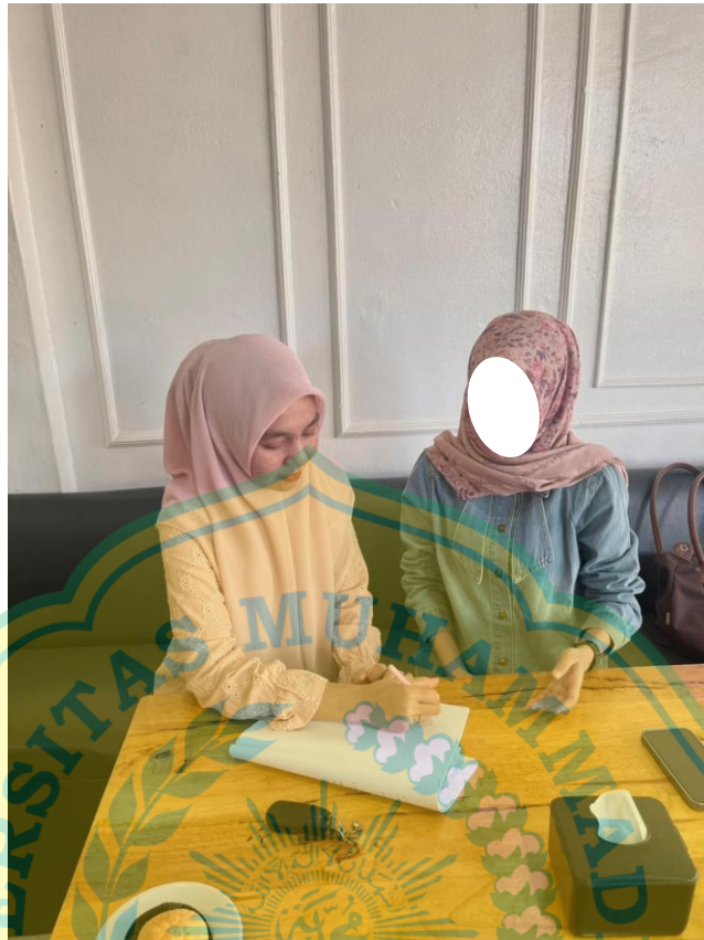
Konsumen (Orang Tua Anak A)