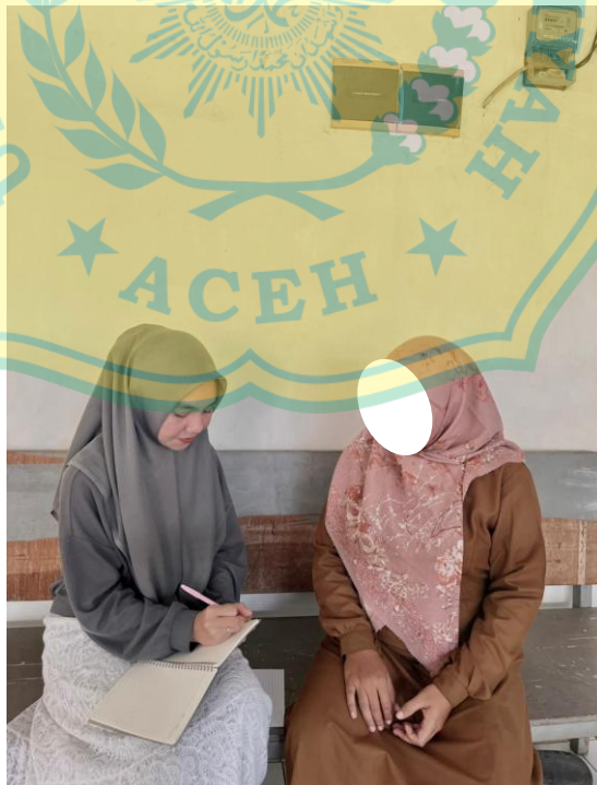
Konsumen (Orang Tua Anak R)