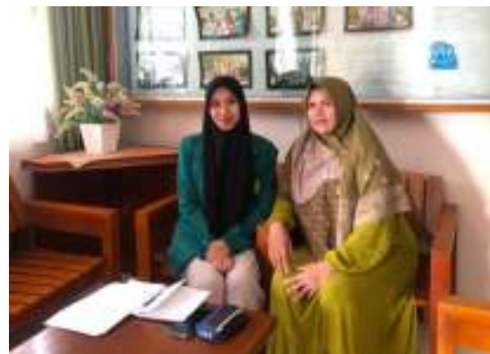
Wawancara Ibu Asuh