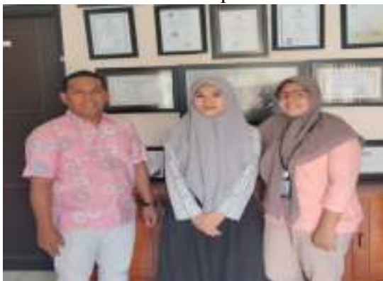
Pimpinan dan Staf