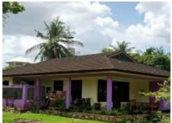
Rumah Anak SOS