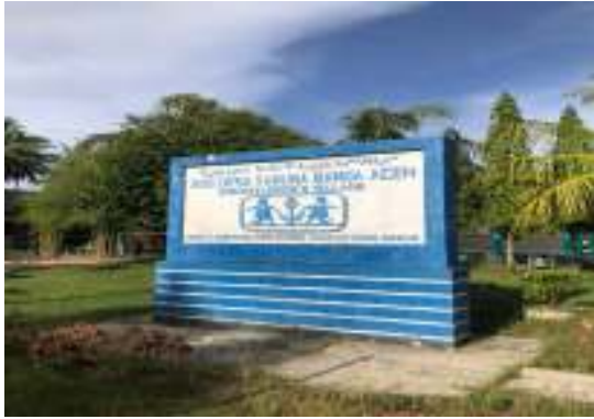
Yayasan SOS Children's Village