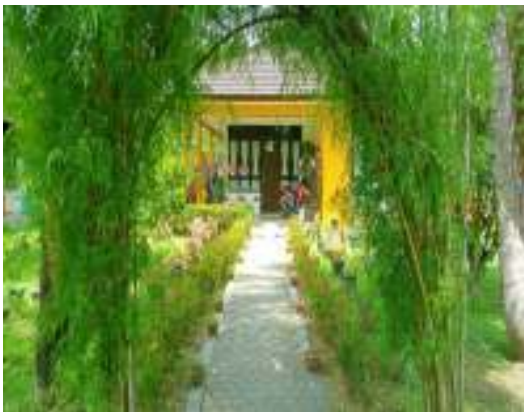
Rumah Anak SOS