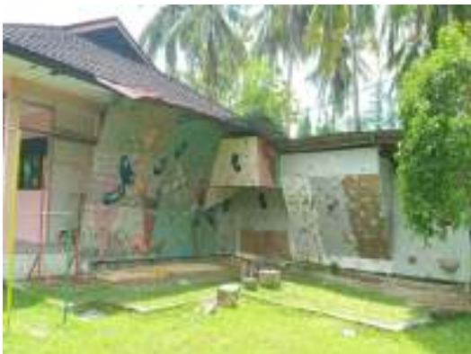
Sarana Prasarana SOS