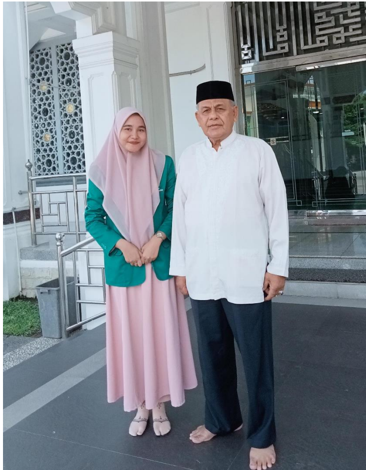
Wawancara Bersama Akademisi Hukum Perdata Pada Tanggal 28 Juni 2025