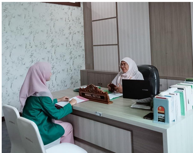
Wawancara Bersama Hakim Mahkamah Syar'iyah Banda Aceh, Pada Tanggal 02 Juni 2025