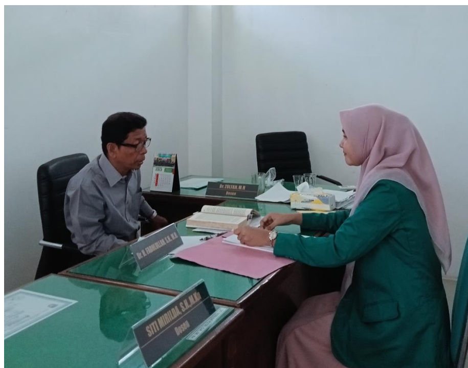
Wawancara Bersama Akademisi Hukum Perdata Pada Tanggal 28 Juni 2025