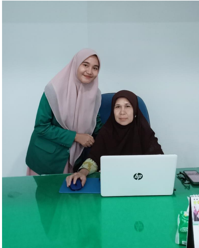
Wawancara Bersama Panitera Mahkamah Syar'iyah Banda Aceh, Pada Tanggal 02 Juni 2025