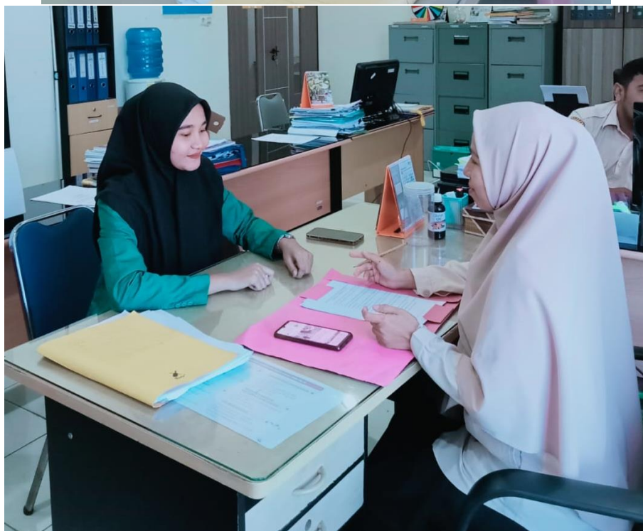
Wawancara Bersama Pejabat Dinas Pemberdayaan Perempuan dan Perlindungan Anak Provinsi Aceh, Pada 18 Juni 2025