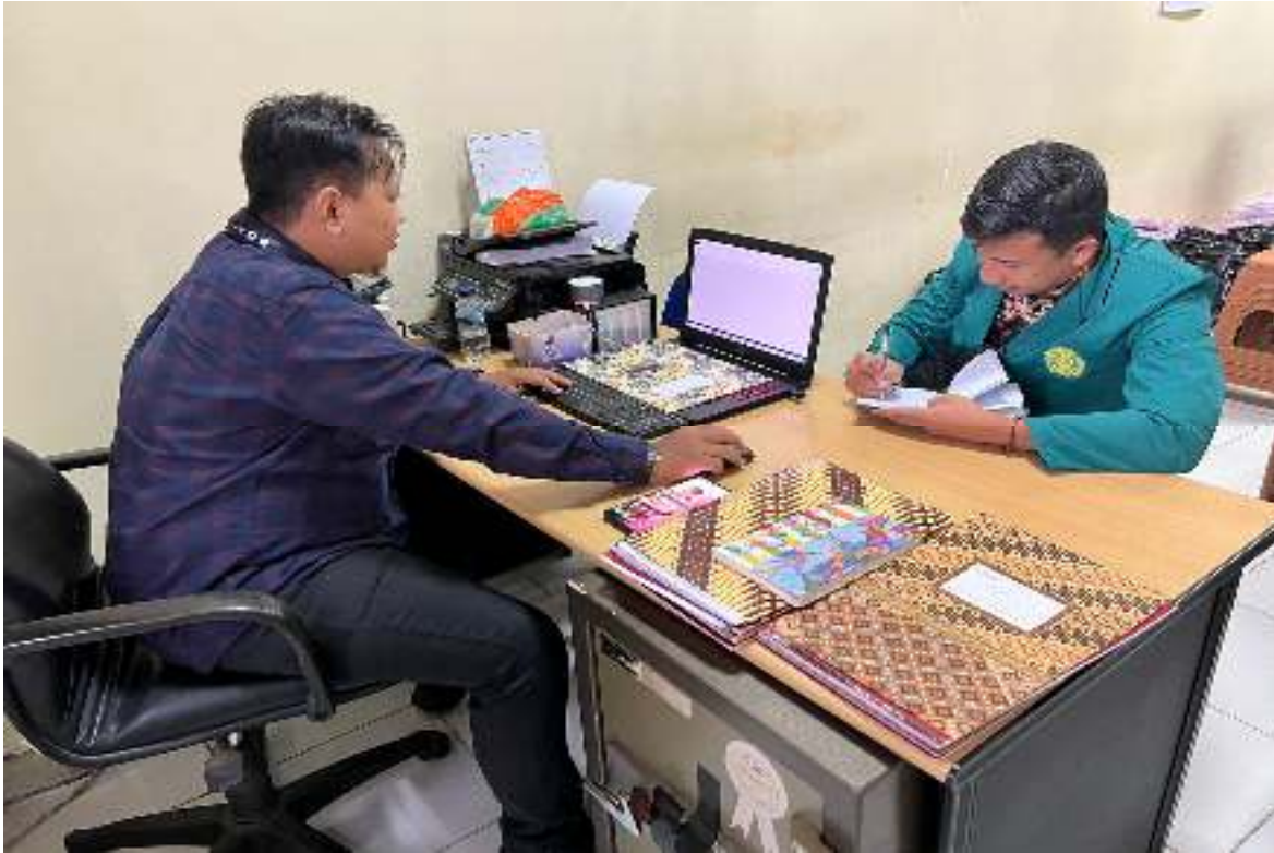
FOTO WAWANCARA PENYIDIK SATRESKRIM POLRESTA BANDA ACEH