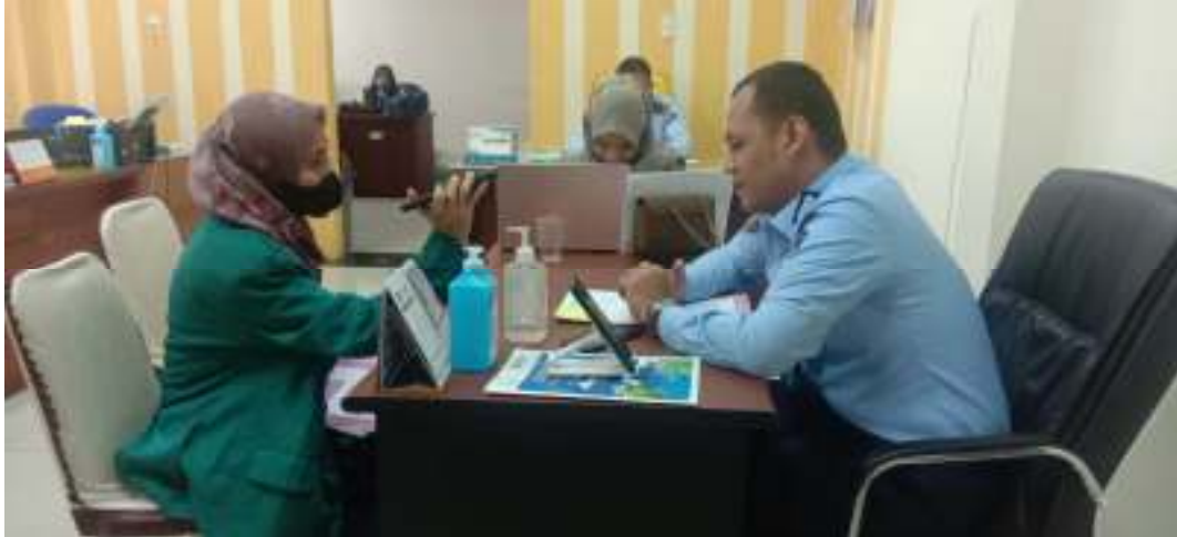
Gambar: wawancara di kantor Kementerian Hukum dan Ham