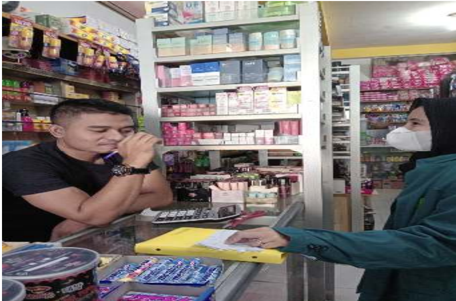
Gambar: Wawancara dengan pemilik toko kosmetik