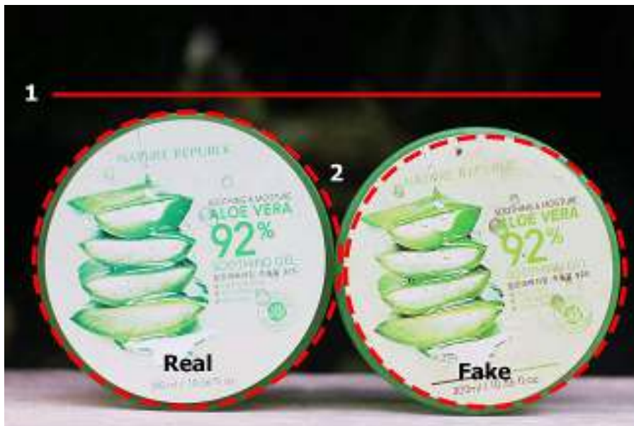
Gambar : perbedaan Nature Republic Aloe Vera Gel 92% asli atau palsu.