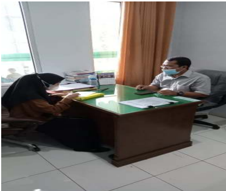
Gambar: wawancara dengan Akademisi