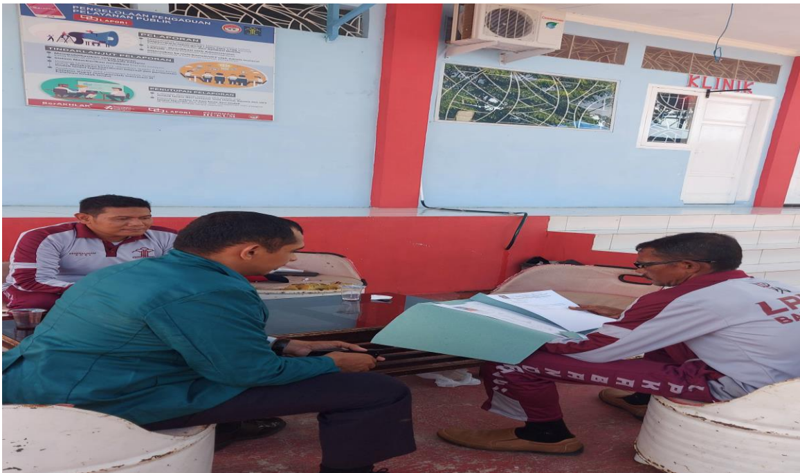
Wawancara dengan Kasi Pembinaan LPKA Kelas II Banda Aceh