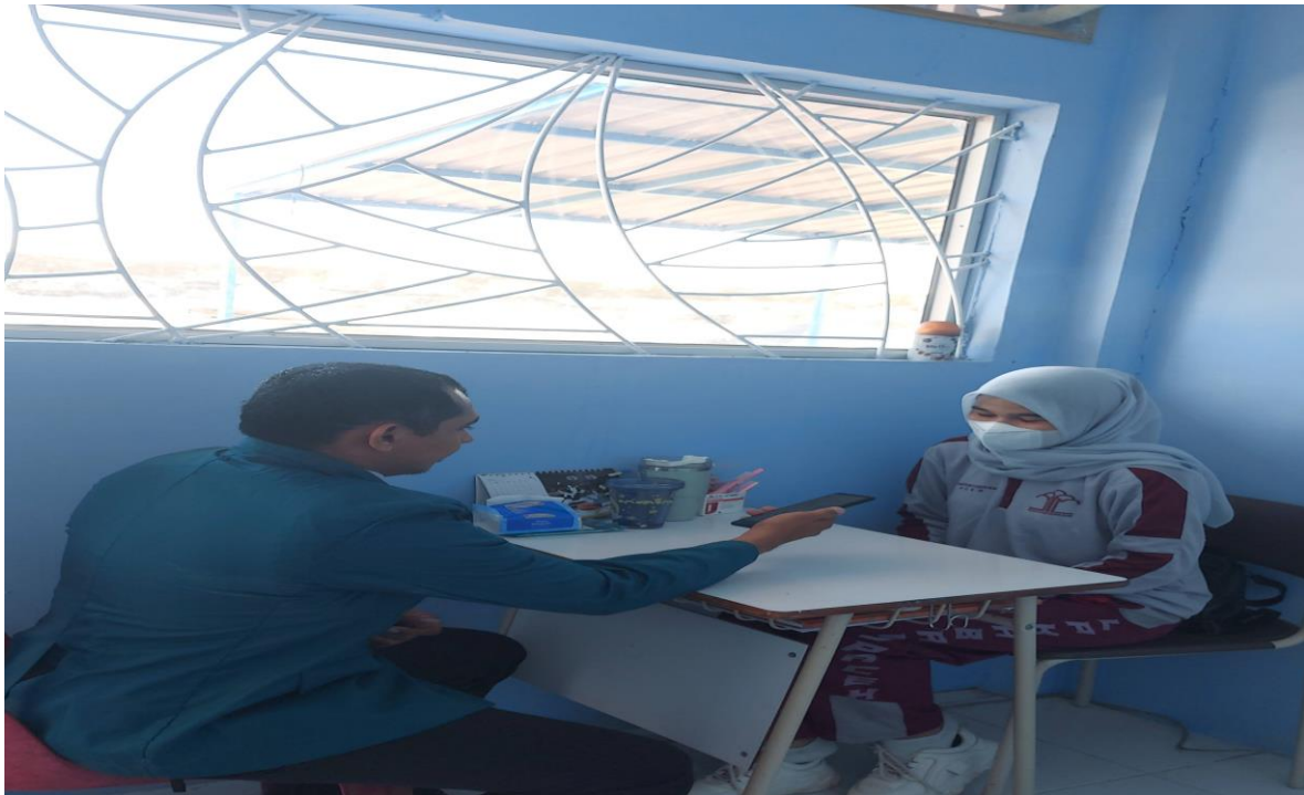
Wawancara dengan Staf Perawat di Klinik LPKA Kelas II Banda Aceh