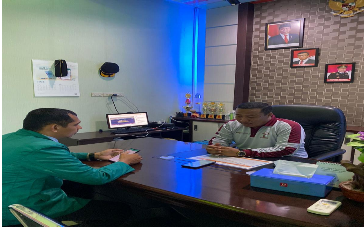
Wawancara dengan Kepala LPKA Kelas II Banda Aceh