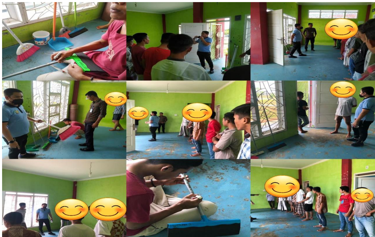
Pembagian Alat Kebersihan