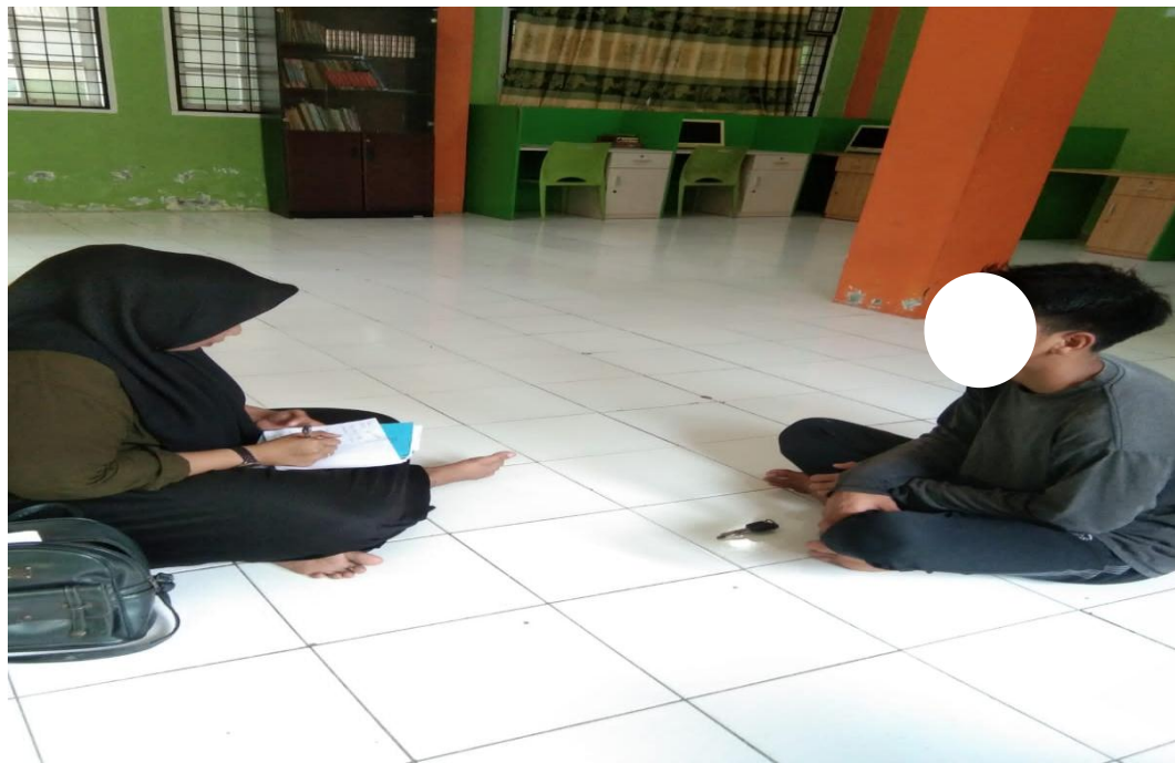
Gambar 2. Wawancara dengan Subjek SG.