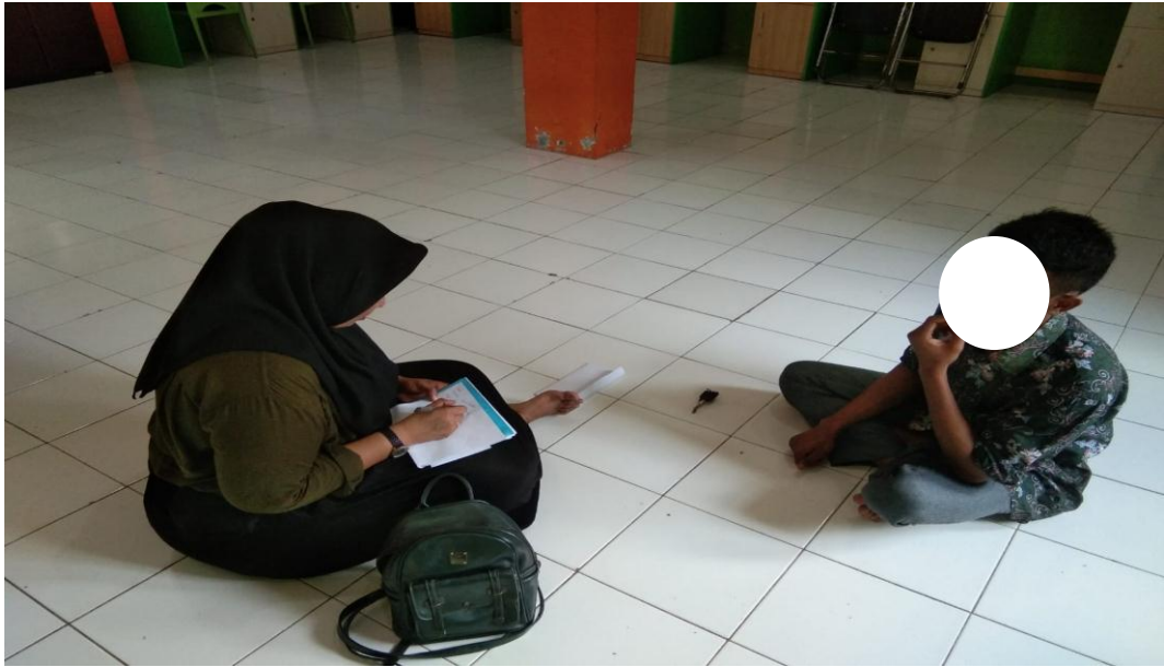
Gambar 3. Wawancara dengan Subjek AR