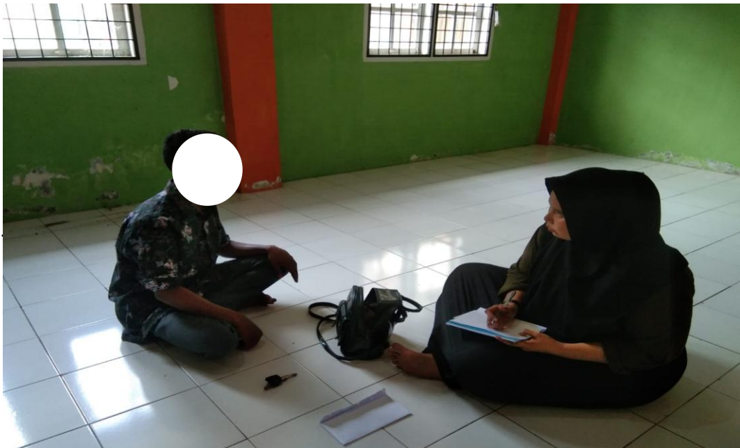
Gambar 4. Wawancara dengan Subjek AR.