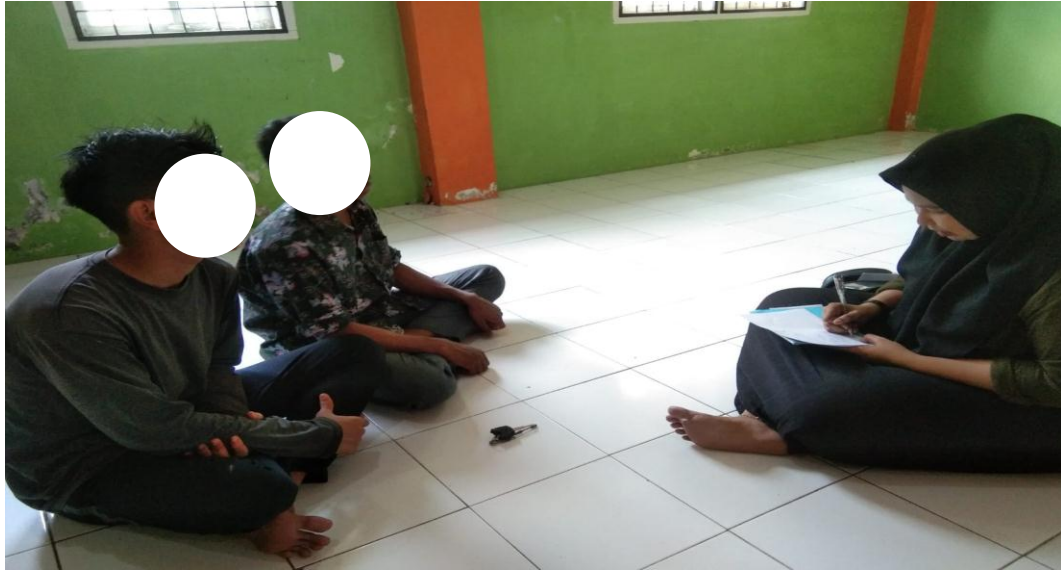
Gambar 1. Wawancara dengan Subjek SG