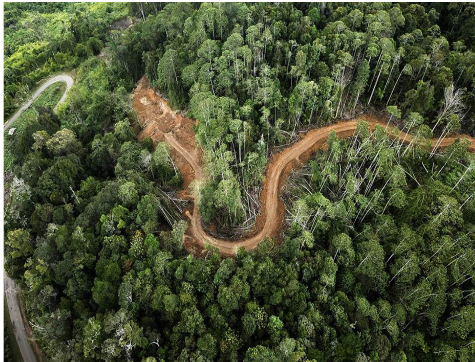
Salah Satu Gambar Yang Menggambarakan Kondisi Hutan Lindung Beutong Yang Rusak Akibat Pertambangan 15

masyarakat di sekitarnya. Hutan lindung adalah kawasan hutan yang mempunyai fungsi pokok sebagai perlindungan sistem penyangga kehidupan untuk mengatur tata air, mencegah banjir, mengendalikan erosi, mencegah intrusi air laut, dan memelihara kesuburan tanah.